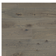
Heritage Eik Old Grey