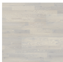
Heritage Eik Chalk White