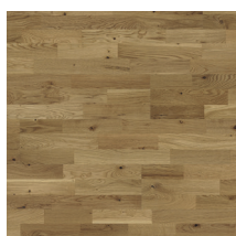
Heritage Eik Classic