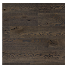
Heritage Eik Old Brown

Bildene viser bare fargen på gulvet. For flere detaljer om gradering og variasjoner se Grading Bok eller www.tarkett.no . Tarketts internasjonale utvalg av gulv består av mange forskjellige produkter. Noen av disse er ikke for salg i Norge. Selv om alle bildene som er tatt for å gjengi det ferdige produktet er gjort på best mulig måte, kan kvaliteten på skjerm og skriver samt naturlig variasjonen i treverket resulterer i variasjoner i farge og struktur av de enkelte parkettbord.