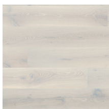
Heritage Eik Opal White