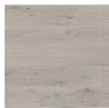
Heritage Eik Urban Grey