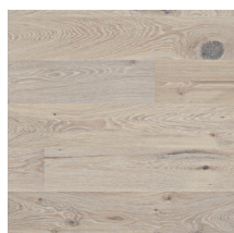
Heritage Eik Lime Stone