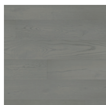
Heritage Eik Dove Grey